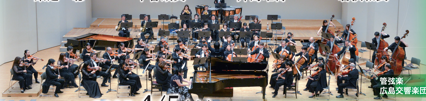
管弦楽 広島交響楽団